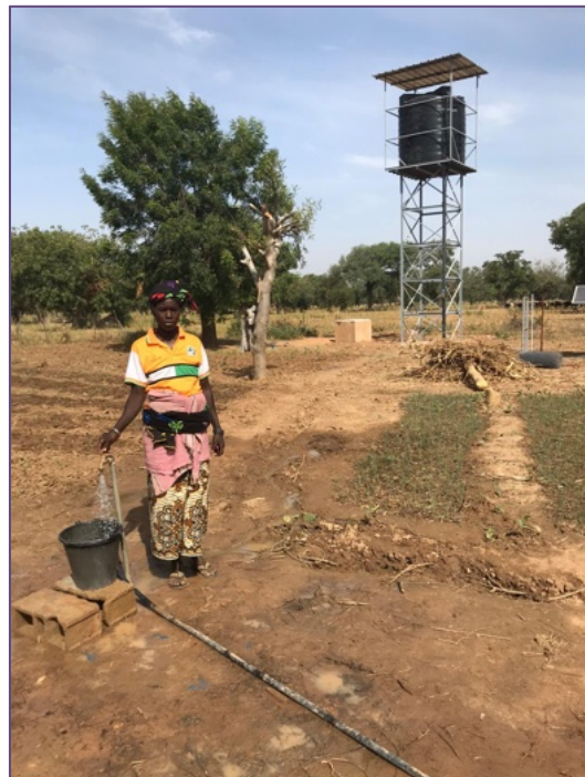
Pozzo con pompa solare a Bilinga