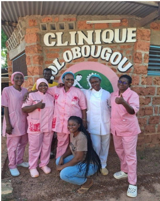
Il gruppo di sages-femmes