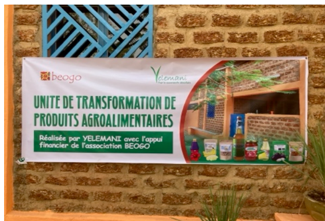
Unità di trasformazione dei prodotti agroalimentari