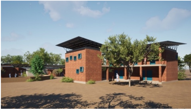
Il progetto della nuova clinica