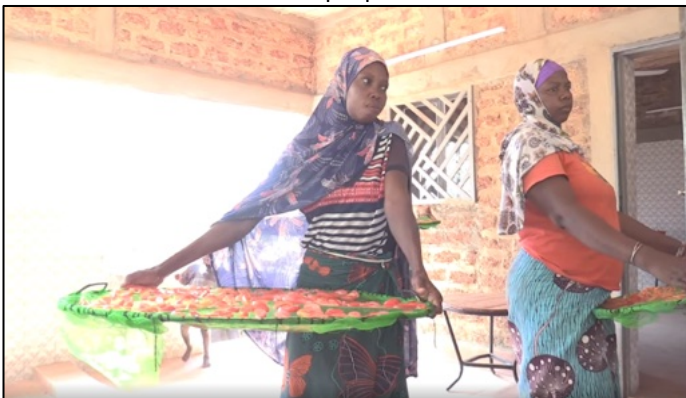
Donne rifugiate impegnate nell'essicazione dei pomodori