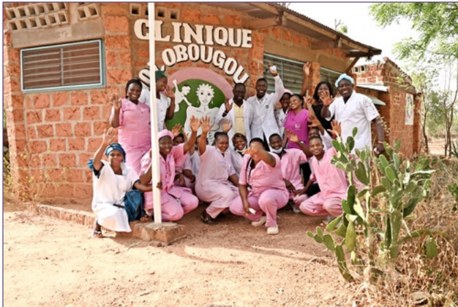
L'attuale piccola Clinica ostetrica rurale