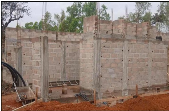
Le pareti del terzo blocco del piano terra

Il progetto è in piena fase di operativa: dopo la realizzazione del secondo pozzo con pompa solare, la recinzione, il locale di accoglienza e per il custode, l'edificio principale, composto da tre blocchi, sta sorgendo e l'obiettivo è quello di terminare, entro fine anno, i primi due blocchi per permettere l'inizio delle attività nel gennaio 2027.