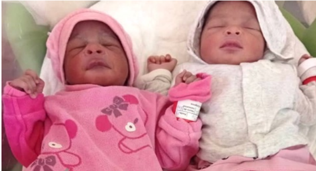
Lieto evento a Farkoba