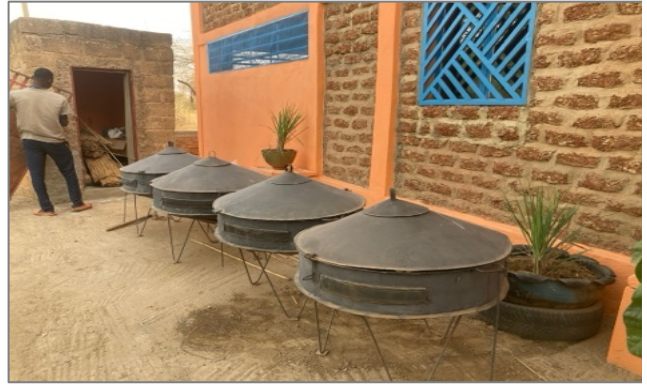
Contenitori per l'essicamento dei pomodori e del mango