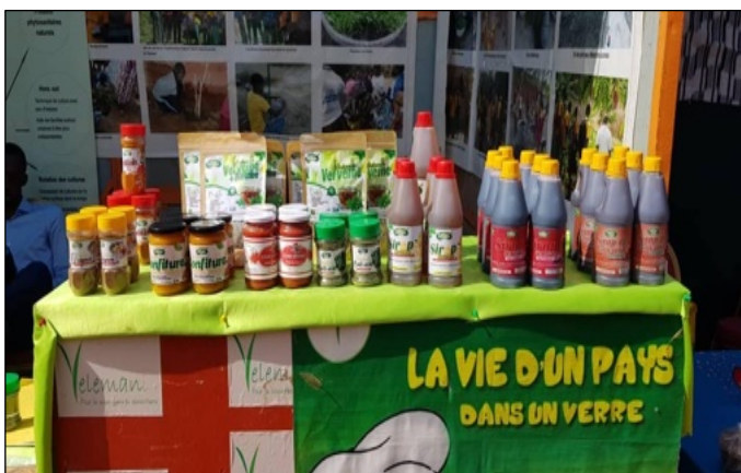
Trasformazione e vendita dei prodotti agricoli

Oltre alla formazione nelle tecniche di essiccaimento, è stata svolta quella in igiene e marketing.