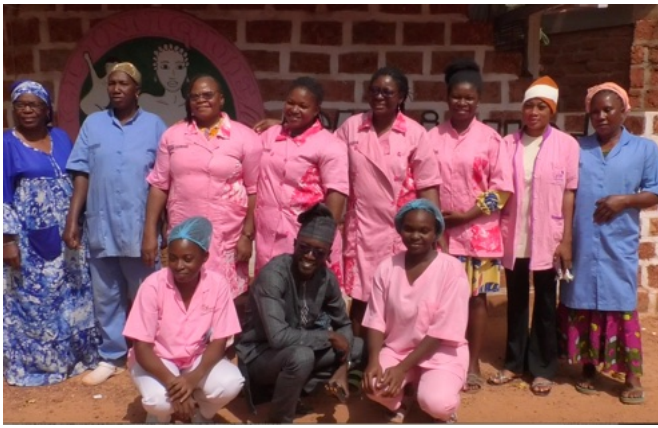
L'équipe della Clinica