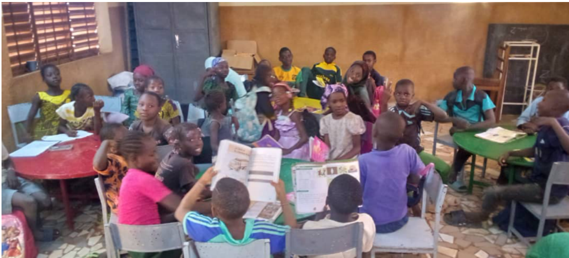
Allievi déplacés ( rescapés ) di Ouahigouya durante una seduta di sostegno

L'impatto del terrorismo nel nord del Paese e nelle zone attorno alla città di Ouahigouya è sempre molto preoccupante. Malgrado ciò, Zoodo, nel 2025, con la nostra collaborazione, ha risposto, con vari progetti, ai bisogni delle popolazioni rifugiate in tre villaggi alla periferia di Ouahigouya: Souli (scuola primaria e pozzo), Gourga (scuola primaria), Baobané-Ouattinoma (scuola primaria e sostegno scolastico a un gruppo di ragazzi rifugiati).