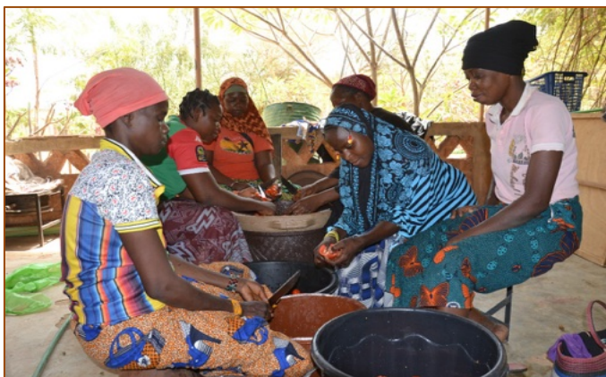
Un gruppo di donne "rescapées" al lavoro nel laboratorio

Il progetto di trasformazione, finanziato da Beogo, permette di accrescere e diversificare le offerte di prodotti agroecologici di Yelemani e di sostenere la comunità di donne produttrici vulnerabili rifugiate interne ( femmes déplacées internes ).