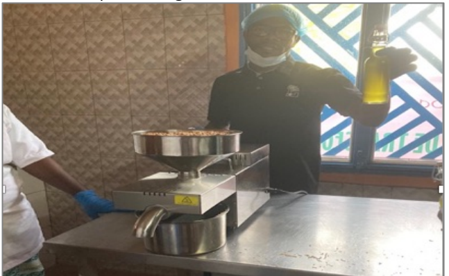
Pressa per l'estrazione di olio di arachidi, sesamo, neem