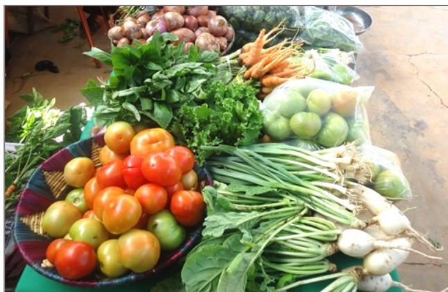
Una ricca offerta di prodotti BIO

Tutte le (15) produttrici lavorano a catena sotto la responsabilità di due anziane trasformatrici con esperienza. Sette di loro, nel corso del progetto, hanno ricevuto una formazione specifica nella trasformazione dei prodotti locali e dell'arachide in olio.