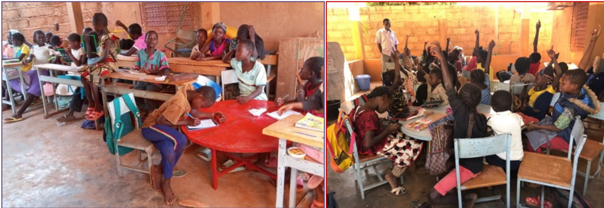
Sostegno scolastico a Ouahigouya

- la scuola dell'infanzia ( Garderie ) di Ouahigouya (3 sezioni: 48 allievi, fino a giugno; 46 da settembre, di cui 24 con giornata continua e cantine di mezzogiorno).