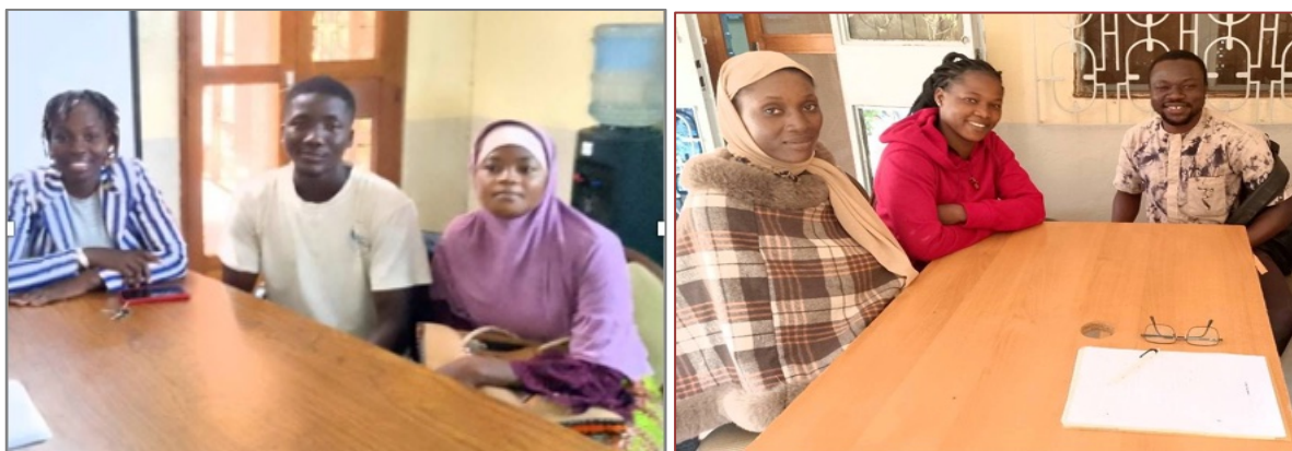
Studenti beneficiari della borsa di studio Yelemani/Beogo (Fondo Maura Bottini) e altri di quella di Zoodo/Beogo (Fondo Eugenio e Mariuccia Galli)