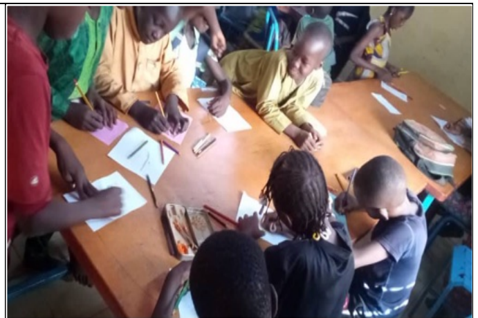
Animazione in biblioteca con gli allievi del sostegno