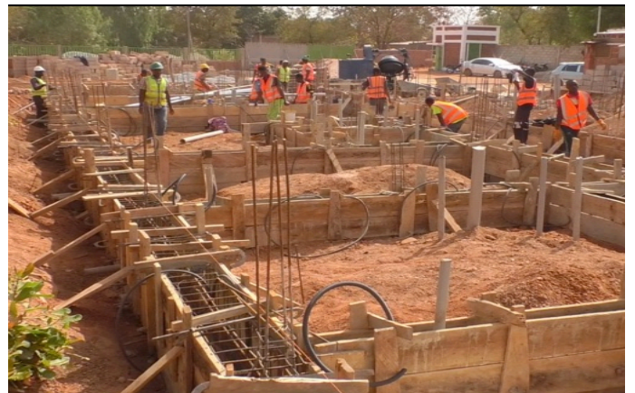
Costruzione del primo blocco del piano terra