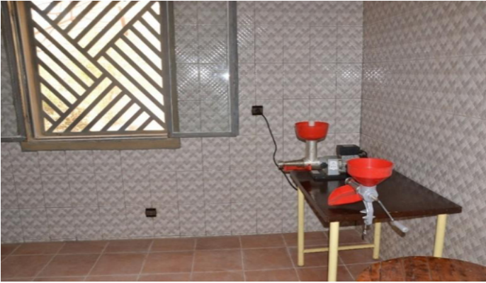
Spazi del nuovo laboratorio per la trasformazione dei prodotti agricoli BIO