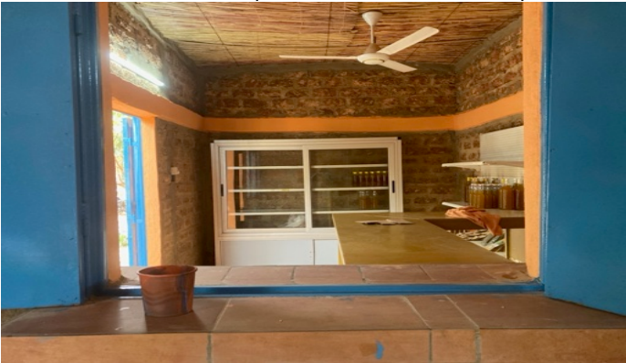
Il locale boutique per le vendite