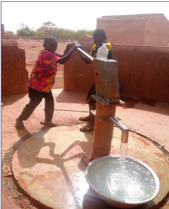
Pozzo nel villaggio di Baporé

- i 17 pozzi per le 3 ONG partner e in un quartiere (10 con pompe manuali, 7 solari), in città e nei villaggi (di questi: 5 occupati dai terroristi...);