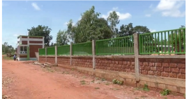
Il locale di accoglienza per il custode e la recinzione

Secondo le previsioni, il nuovo centro dovrebbe essere operativo nel 2027 e avrà la capacità di accogliere fino a 6'000 pazienti all'anno. Si tratta del più importante progetto da sempre finanziato da Beogo.