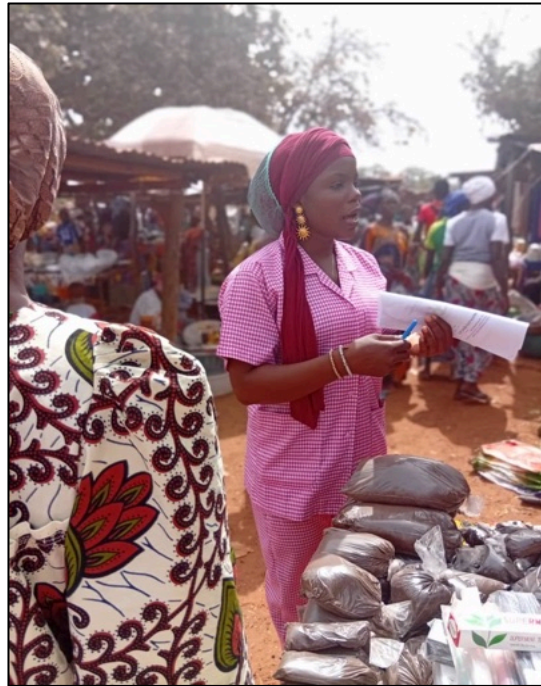
Interventi sul terreno ( Clinique poussière ) in un giorno di mercato grazie all'ambulanza finanziata da Beogo