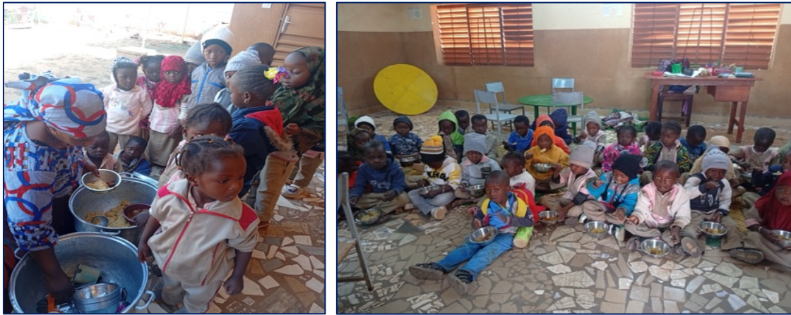
I bambini della Scuola dell'infanzia al momento della merenda