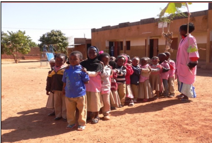
Allievi di una sezione della Garderie

- la scuola dell'infanzia ( Garderie ) di Ouahigouya (3 sezioni: 48 allievi, fino a giugno; 46 da settembre, di cui 24 con giornata continua e cantine di mezzogiorno).