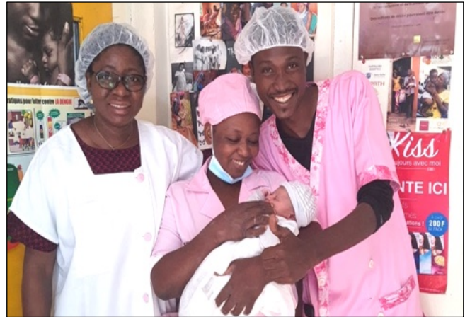
Honorine con due collaboratori della sua équipe