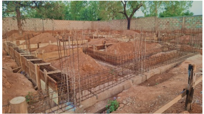
Iniziate le opere di fondazione