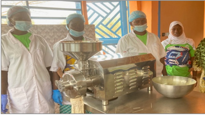
Mulino per prodotti agricoli secchi (cereali, frutti, legumi)