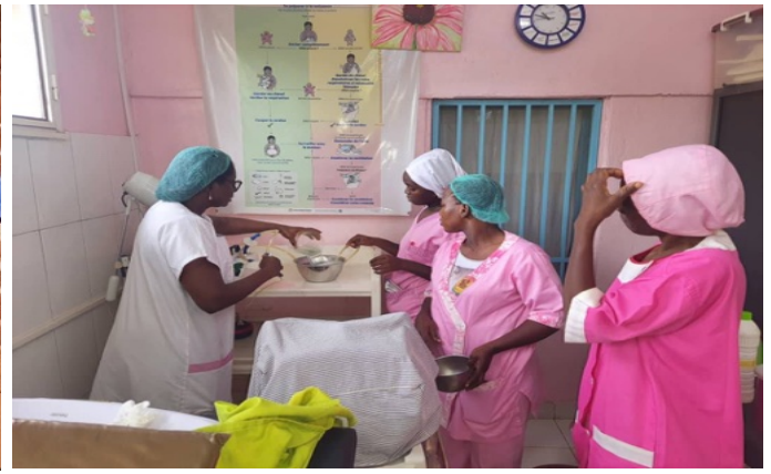
Le sages-femmes in piena attività

Il progetto è attualmente in piena fase operativa. Sono stati completati la recinzione dell'area, la costruzione del locale di accoglienza per il custode e un magazzino per i materiali. È stato realizzato un secondo pozzo, dotato di un serbatoio da 20'000 litri e di una pompa solare. Sono avanzati i lavori per la costruzione del piano terra dell'edificio principale della nuova Clinica. Il nuovo stabile ospiterà le sezioni dedicate alle cure ambulatoriali, stazionarie e il blocco chirurgico. La costruzione dell'edificio amministrativo è prevista in una fase successiva.